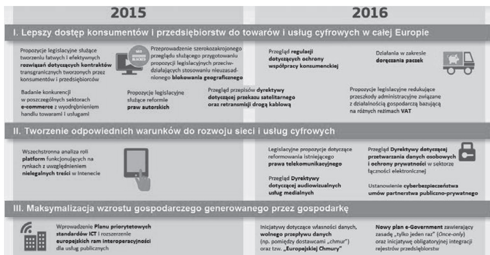
Rys. 1. Inicjatywy składające się na tzw. mapę drogową tworzenia JCR UE