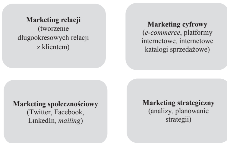
Rys. 1. Obszary nowoczesnego marketingu

przez każde nowoczesne przedsiębiorstwo. Wspomniany wcześniej marketing relacji oraz marketing doświadczeń mają za zadanie dotrzeć do klientów również za pośrednictwem Internetu. Zbieranie baz danych klientów, wszelkie informacje o nich pochodzą z portali aukcyjnych, sklepów internetowych, w których się zaopatrują.