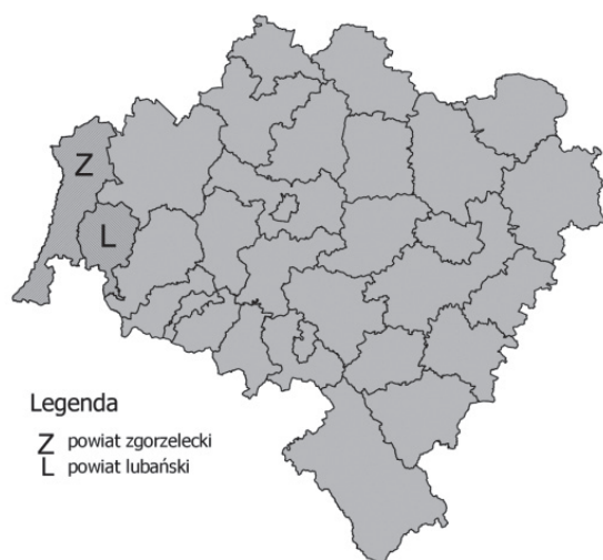
Rys. 1. Lokalizacja powiatu zgorzeleckiego i lubańskiego na tle województwa dolnośląskiego