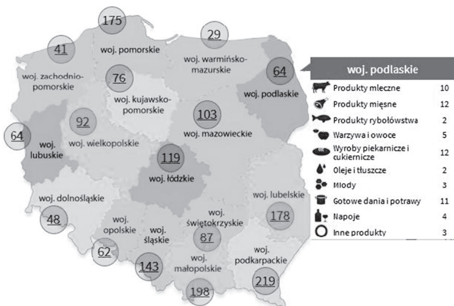
Rys. 1. Produkty tradycyjne według województw

kartacze sejneńskie/cepeliny, chołodziec, soczewiaki sejneńskie, kolduny litewskie, kartacze, kışkę ziemniaczaną, babkę ziemniaczaną, pieriekaczewnik, pierogi węgierskie oraz kociołek cygański. W tej samej kategorii w Bazie Produktów Lokalnych z Podlaskiego znalazło się: 4 producentów babki ziemniaczanej, po 1 – wytwórca blinów litewskich i gęsi po staropolsku, 2 producentów chłodzka litewskiego i 7 producentów kartaczy.