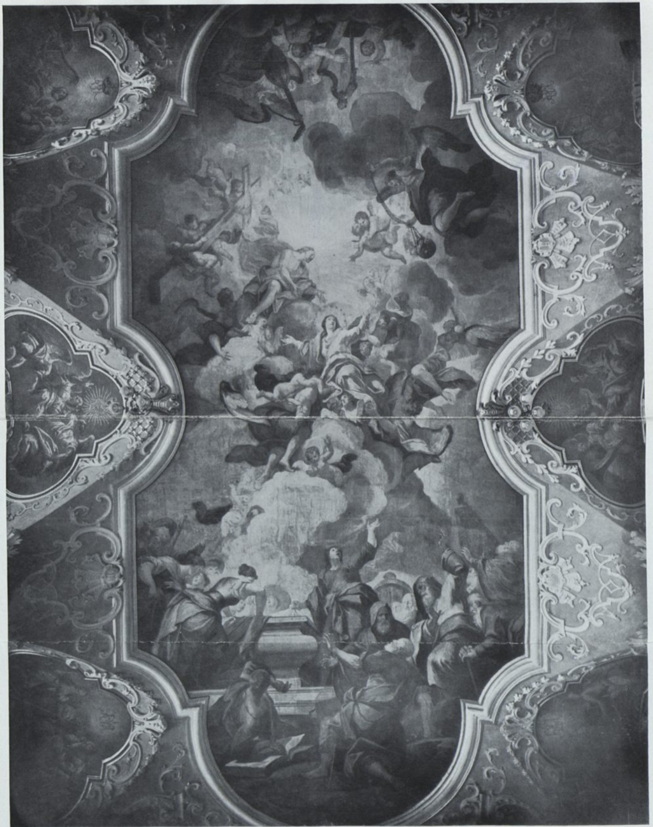
Deckengemälde des Musiksaales