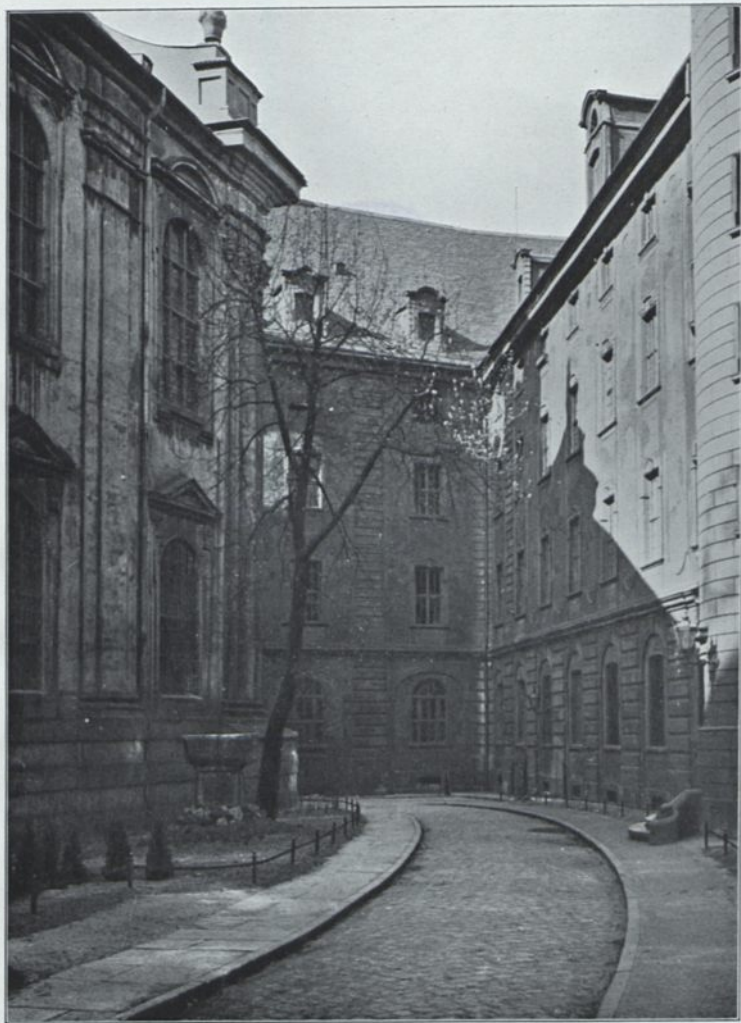
Phot. Th. Lichtenberg A. Koelsch