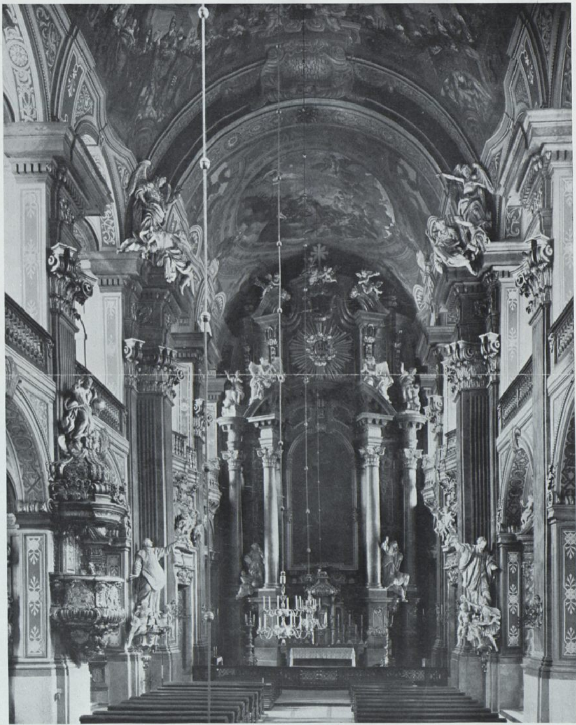
Inneres der Matthiaskirche