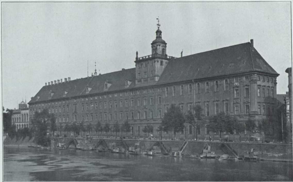
Phot. Ed. van Delden H. Goetz