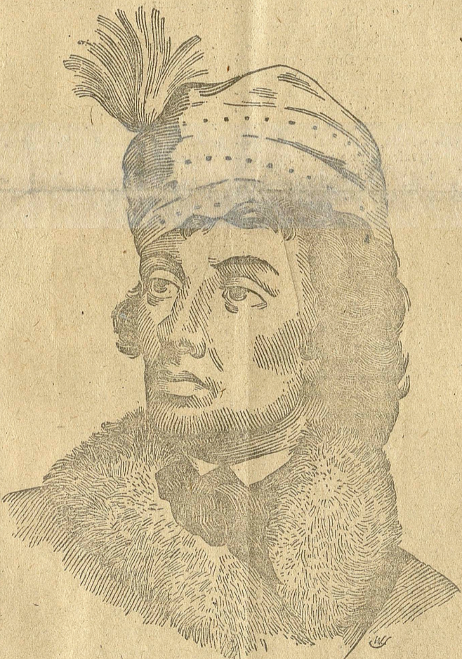
rys. Wł. Stańczykowski

gich muszą być skutkiem złej chęci lub obęgi natchnienia, aby zupełnie zapadł do obrony Ojczyzny w sercach ludu osłabić.