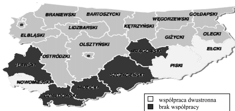
Rys. 3. Powiaty woj. warmińsko-mazurskiego współpracujące z Obwodem Kaliningradzkim FR