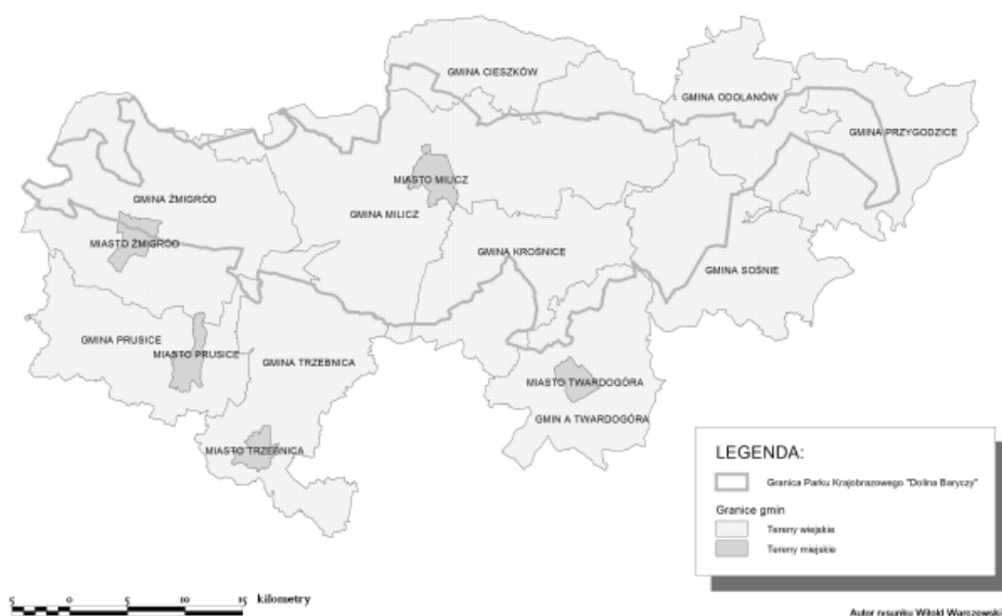
Rys. 1. Położenie Parku Krajobrazowego „Dolina Baryczy” na obszarze dziesięciu gmin

Park Krajobrazowy „Dolina Baryczy” (PK „Dolina Baryczy”) zlokalizowany jest w granicach dwóch województw, w województwie dolnośląskim, w jego części północno-wschodniej, znajduje się 70 040 ha, znacznie mniej w województwie wielkopolskim, bo 17 000 ha (rys. 1).