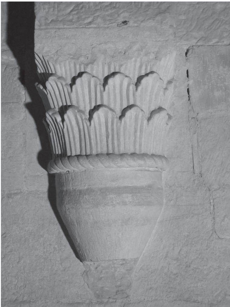
Opactwo cystersów w Wąchocku, wspornik w kapitularku Cistercian Abbey in Wąchock, the cantilever in the chapterhouse