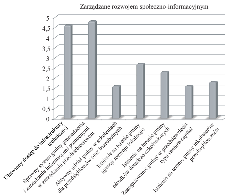
Rys. 1. Wyniki oceny instrumentów związanych z rozwojem społeczno-informacyjnym